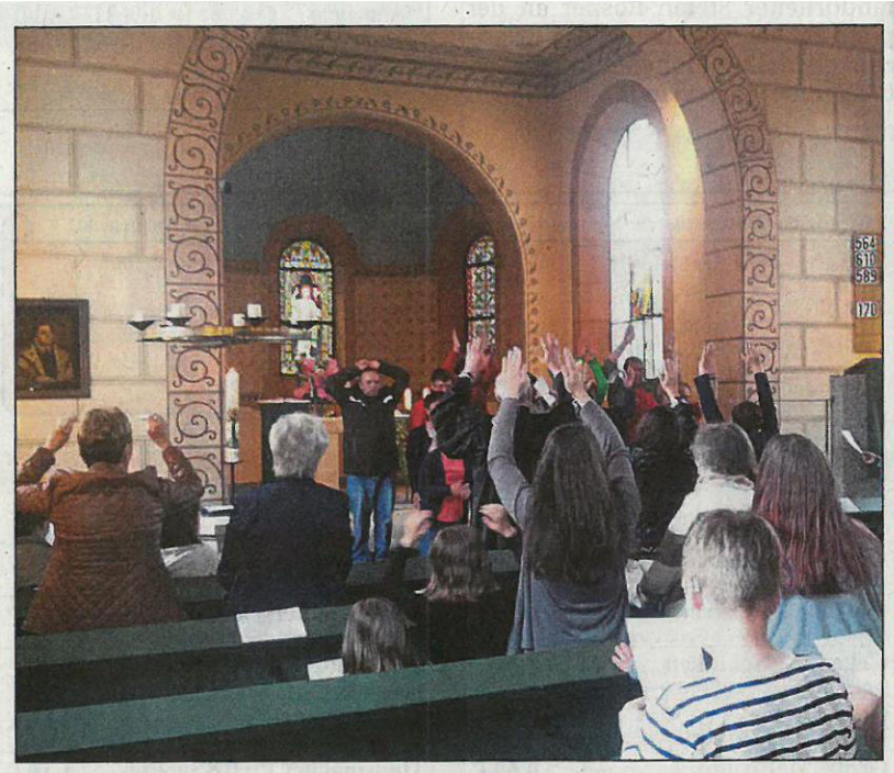
04.06.2016 Inklusiver ökumenischer Gottesdienst in Mitterteich zum Thema „Ein Schiff, das sich Gemeinde nennt“.