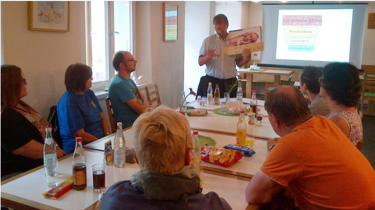
16.09.2016 - „Schnellkurs Politik“ – 1. Baustein der „Demokratie-Werkstatt für alle“ im Mehrgenerationenhaus Mitterteich